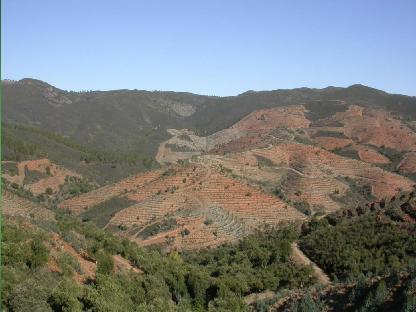
Corta de eucaliptos en Las Contiendas, intercalada entre los otros hábitats típicos de esta sierra, el monte mediterráneo (primer término) y los matorrales con árboles aislados, hábitat de cría del Buitre Negro (al fondo de la imagen)