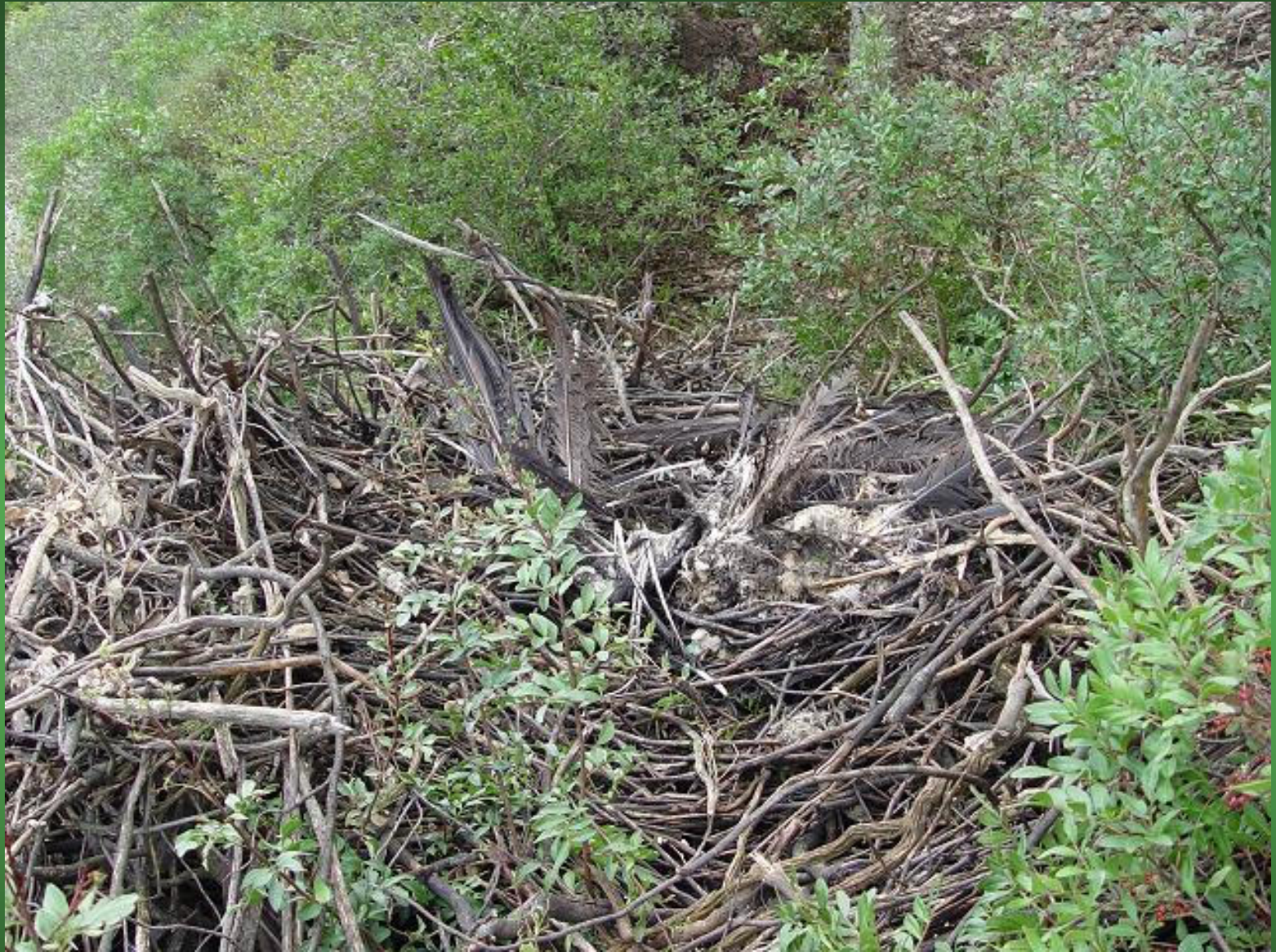
Restos (se ven plumas) del cadáver de uno de las aves propietarias de un nido de Las Contiendas que apareció caído sobre el suelo.