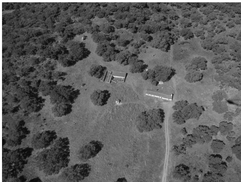
Imagen aérea de Puerto Moral

La encina simboliza un ecosistema y una cultura socio-económica. En esa finca, propiedad de la Fundación Monte Mediterráneo, se lleva a cabo una explotación agrosilvopastoral que permite una gestión compatible con la conservación de los recursos naturales y la biodiversidad propia de la dehesa.